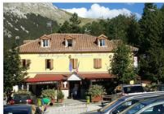
L'hotel com'era un tempo